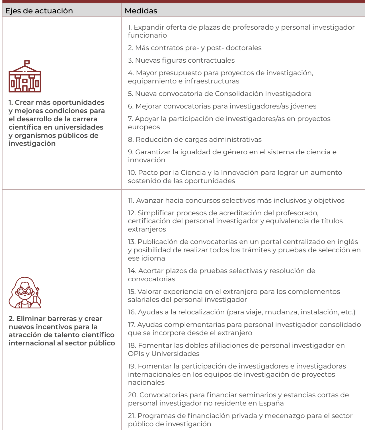
TABLA 1. PLAN DE ATRACCIÓN Y RETENCIÓN DE TALENTO CIENTÍFICO E INNOVADOR A ESPAÑA BATERÍA DE MEDIDAS PARA 2022-2023