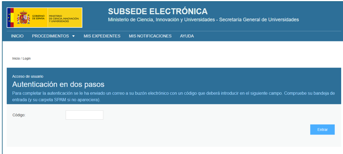
Ilustración 3. Solicitud de código de verificación

Tras esta validación inicial, recibirá un código temporal en su dirección de correo electrónico registrada. Es posible que existan retrasos de segundos, tanto en la recepción del correo electrónico con el mensaje que incluye el código de verificación, como en la activación del botón de acceso una vez pulsado para ir a la segunda pantalla.