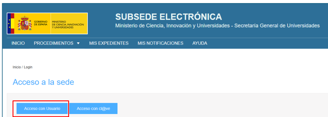
Ilustración 1. Autenticación de usuario (I)

Para acceder al sistema, el usuario deberá introducir a través del botón de Acceso con Usuario, su cuenta de correo y contraseña como hasta ahora.