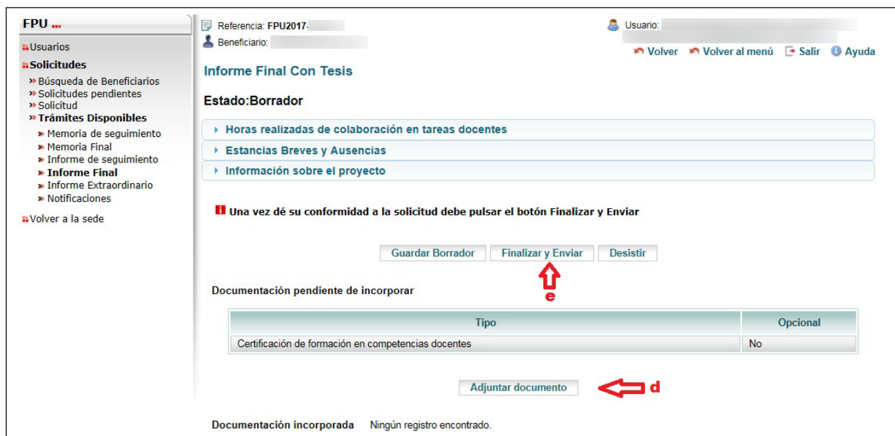
Figura 4.2. Informe Final Con Tesis – Finalizar y enviar